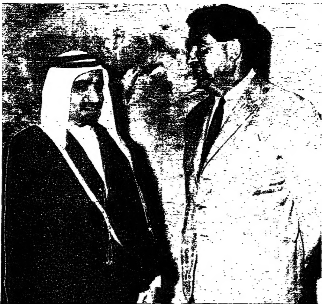
الشيخ خليفة بن حمد ثاني نائبه يمشي يتحدث الى امير نيسيس جيليس وزير الدفاع البريطاني